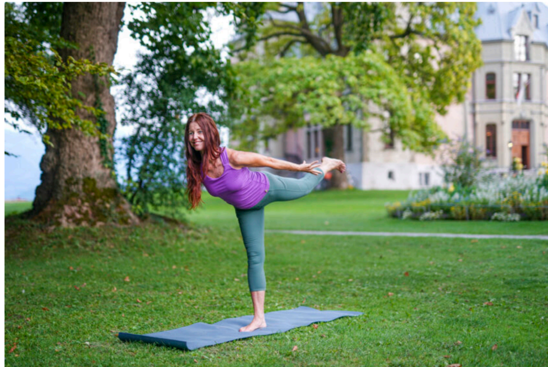
Open Sky Yoga